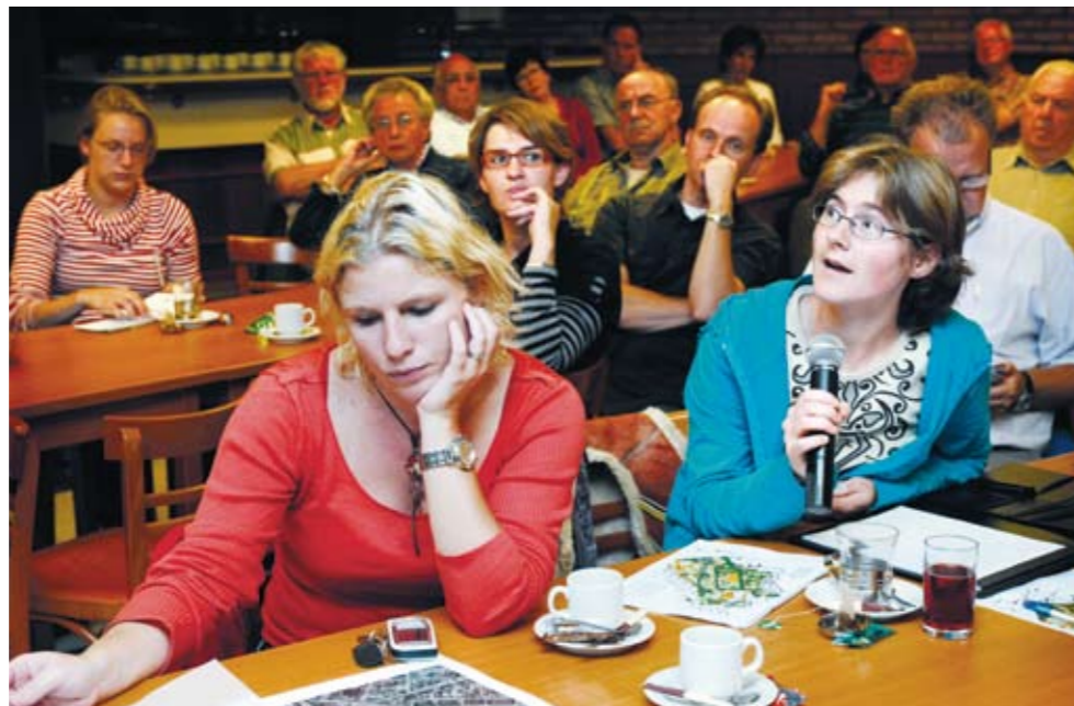
Vertaal ingewikkelde materie in simpele meerkeuzevragen

Tekst: Carmen Schothuis