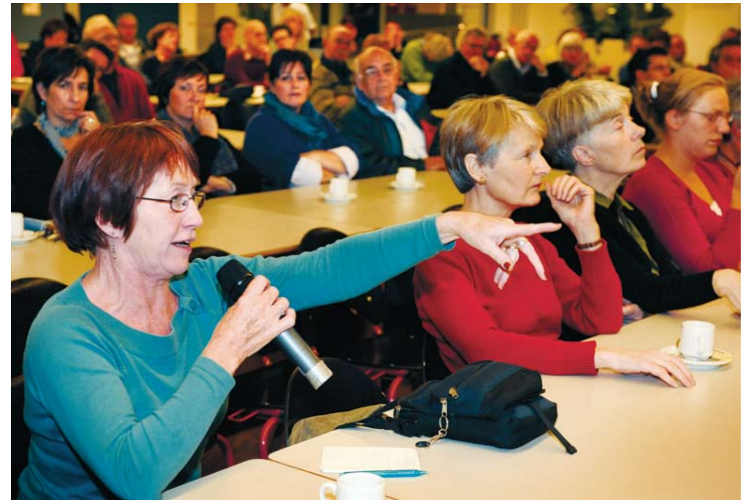
Een beetje bestuurder durft tegenwoordig niet voorbij te gaan aan burgerparticipatie en interactieve beleidsvorming

len? Neemt u genoeg met minder schone straten en onkruid tussen de stoeptegels of mag de publiekswinkel 's middags dicht?' Dit vergt behoorlijk wat rekenwerk op voorhand, maar dan heb je ook wat. De uitslag geeft mooie staafjes met percentages: de bevolking heeft duidelijk gekozen. Er hoeft niet nog eens een bestuurlijk besluit genomen te worden, want anders zou die burger-