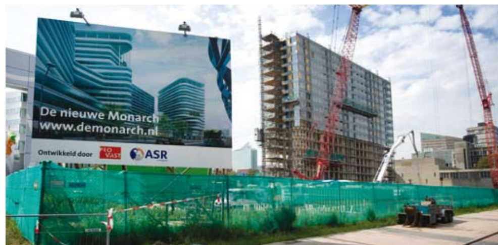
In Den Haag (Beatrixkwartier) wordt momenteel De Monarch herontwikkeld

De concept-kantorenstrategie tot 2020 heeft als uitgangspunt dat het Stadsgevest Haaglanden wil beschikken over een wervende, gezonde kantorenmarkt. Een gezonde kantorenmarkt betekent de juiste kantoren (zowel kwantitatief als kwalitatief) op de juiste plekken in Haaglanden. Daarbij hoort een leegstand die groot genoeg is om bedrijven een goede keus te geven en beweging in de markt mogelijk te maken, de zogenaamde frictieleegstand. Deze frictieleegstand komt overeen met zes procent van de voorraad: voor Haaglanden is dat 0,4 miljoen m 2 , aanzienlijk minder dan de één miljoen die nu leegstaat. Dit vergt een forse reductie van de leegstand in combinatie met renovatie en alleen nieuwbouw waar behoefte is. Kortom: gezamenlijk voorraadbeleid van de gemeenten. Om dit te bereiken moeten de gemeenten, volgens de strategie, met elkaar bindende afspraken maken over de overmaat nieuwbouwplannen en hoe de reductie van de leegstand te stimuleren. "De gevraagde visie op sloop en transformatie staat in de strategie. Voor de uitvoering hebben we uiteraard de commerciële partijen nodig die in de kantorenmarkt actief zijn: het is immers in ieders belang dat Haaglanden een gezonde kantorenmarkt heeft!" besluit Pieter van Genuchten, sectorhoofd Economie van Haaglanden. De planning is om deze strategie komende winter bestuurlijk vast te leggen.