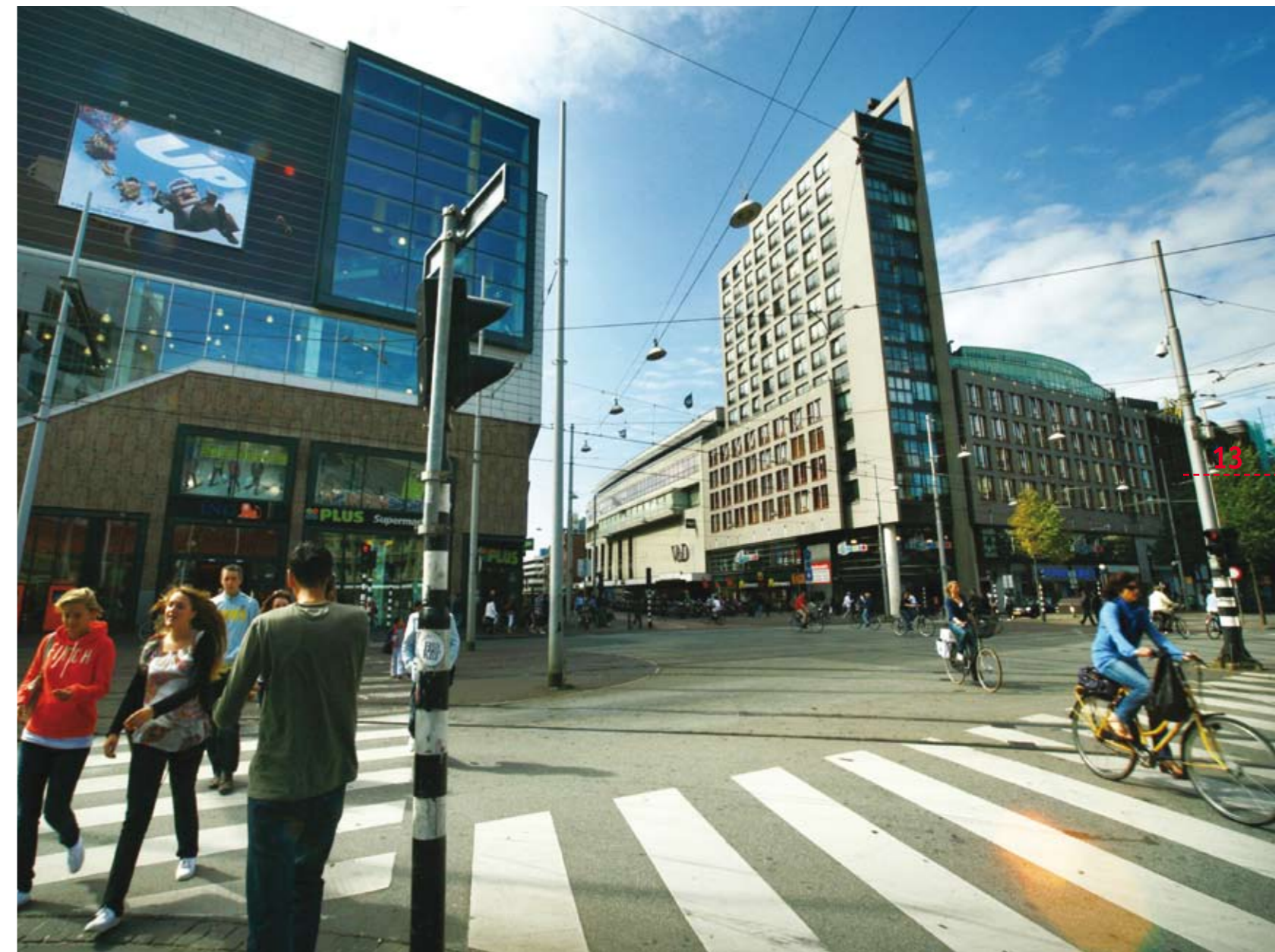
De KvK werkt samen met gemeenten en ondernemers aan een betere kwaliteit van het gebied waar hun bedrijven staan.