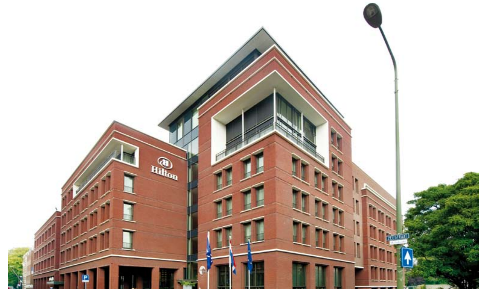
In het oude hoofdkantoor van de PTT uit de jaren vijftig is in 2010 het Hilton Hotel Den Haag (Zeestraat) geopend