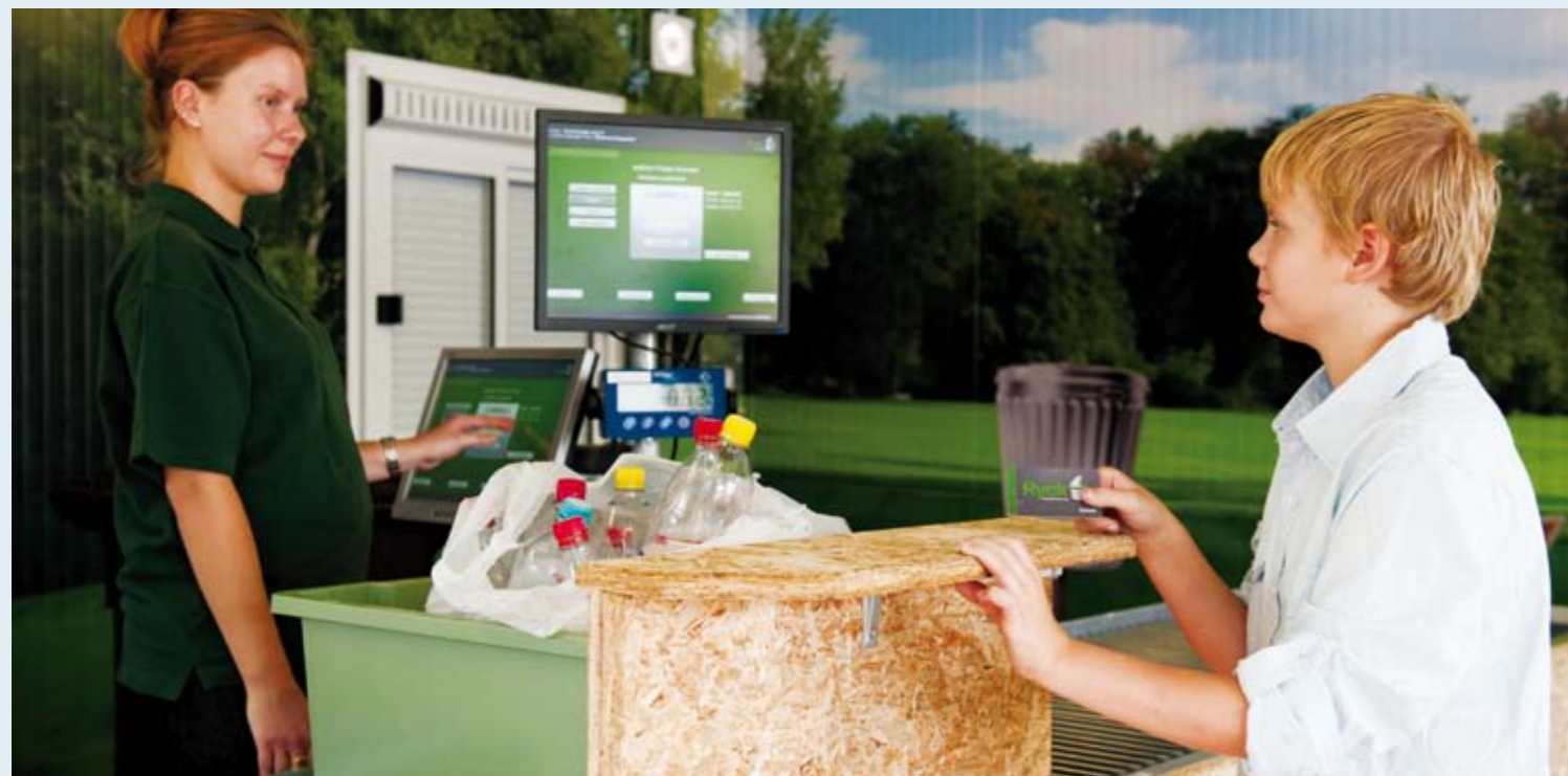
Eén van de inzamelpunten

Door deel te nemen, dragen inwoners bij aan betere scheidingsresultaten op het restafval, méér recycling van grondstoffen en daarmee aan een beter milieu. Als iedereen zich bewust wordt van de waarde van afval, zal mogelijk ook het zwerfafval afnemen. Dat levert een schonere woonomgeving op.