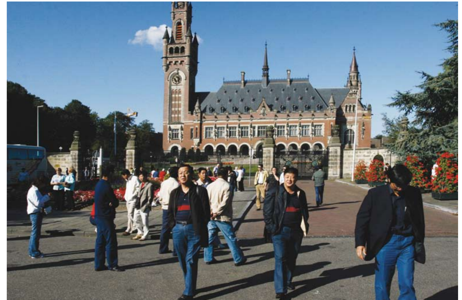
Jaarlijks brengen gemiddeld 53 miljoen mensen een bezoek aan Den Haag

We moeten zorgen dat de stad als toeristische trekpleister nog steviger op de internationale kaart komt te staan. Zeker ook vanuit internationaal perspectief. Juist op het vlak van verblijftoerisme is in Nederland de stedelijke concurrentie het hevigst. Speerpunt is dan ook onze kandidaatstelling voor Culturele Hoofdstad 2018." Chique bewegwijzeringsborden Als stad wil Den Haag nog meer toeristen trekken. "We moeten door de ogen van de toerist leren kijken. Hij kent de stad niet, maar we kunnen hem wel helpen." De Jong noemt een drietal simpele voorbeelden. "In de stad staan al jaren chique bewegwijzeringsborden. Compleet met 'gouden' letters. Onder die borden hangen sinds kort kleine vierkante plattegronden in de Engelse, Duit-