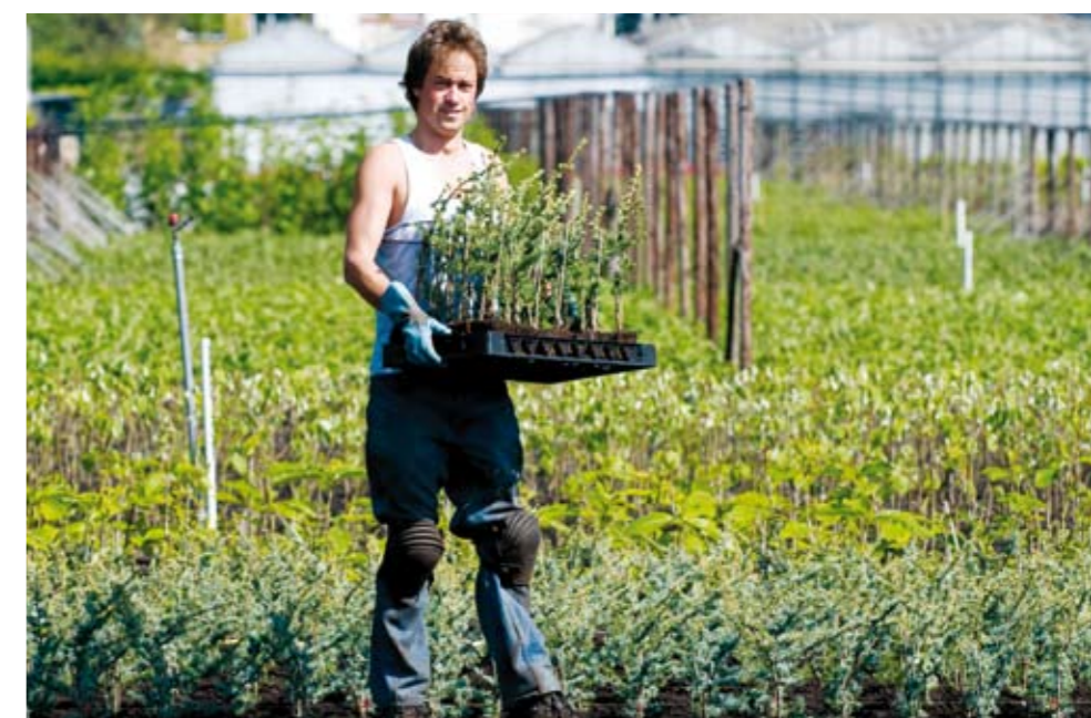
Volgens schattingen werken circa 200.000 arbeidsmigranten uit de Midden- en Oost-Europese landen in Nederland

Westland heeft dit opgepakt door actief de samenwerking te zoeken met de uitzendbranches. Ook is een Poolse sprekende consultant in de arm genomen om het vertrouwen van de Poolse gemeenschap te winnen. Wethouder Weverling van Dienstverlening en Internationalisering: "Deze aanpak heeft inmiddels zijn vruchten afgeworpen. Westland heeft de registratie van arbeidsmigranten op de landelijke agenda geplaatst. We hopen met onze ervaringen ook andere gemeenten te kunnen helpen." Ook landelijk draait Westland volop mee bij de ontwikkeling van het beleid van minister Kamp. Westland is vertegenwoordigd in de landelijke werkgroepen die zich bezig houden met de vijf speerpunten uit het beleid: registratie, huisvesting, werk, handhaving en voorlichting. Regionaal wordt samengewerkt om het beleid van Minister Kamp uit te gaan