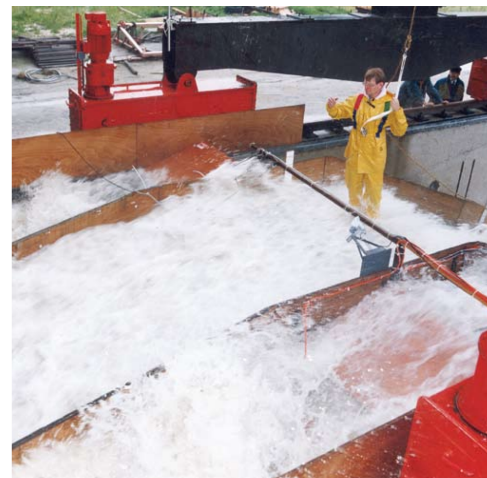
Deltares onderzoekt de 'groene dijk' in de Deltagoot

water- en deltasector van profiteert. Het creëren van cross sectorale projecten is één van de expertises van de Kennisalliantie en sluit goed aan bij de nieuwe regionale economische agenda voor de Zuidvleugel. Hierin wordt juist voor