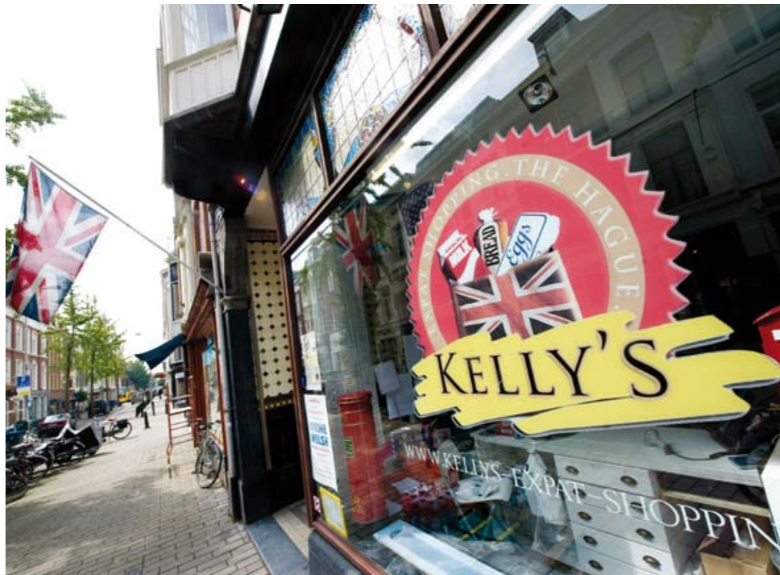
Een expatwinkel in Den Haag. Internationale medewerkers spenderen een kleine zevenhonderd miljoen euro aan goederen en diensten in Haaglanden.

In juni van dit jaar liet het Europees Octrooi Bureau (EOB) weten dat zij naast hun huidige kantoor in de Plaspoelpolder een nieuw pand willen laten bouwen. Zodra het nieuwe gebouw klaar is, wordt de bestaande hoogbouw gesloopt. Zij investeren hiermee de komende jaren 250 miljoen euro in het bedrijventerrein en blijven met hun circa drieduizend medewerkers in Rijswijk gevestigd. Het EOB heeft zich in 1977 gevestigd in Rijswijk en er is in de loop der jaren een hechte band ontstaan met de gemeente. Het is de grootste internationale vestiging in Rijswijk en economisch van enorme waarde. Niet alleen voor deze gemeente, maar ook voor de regio. Burgemeester Ineke van der Wel liet weten erg blij te zijn met het besluit om in Rijswijk te blijven. "Op een goed zicht-