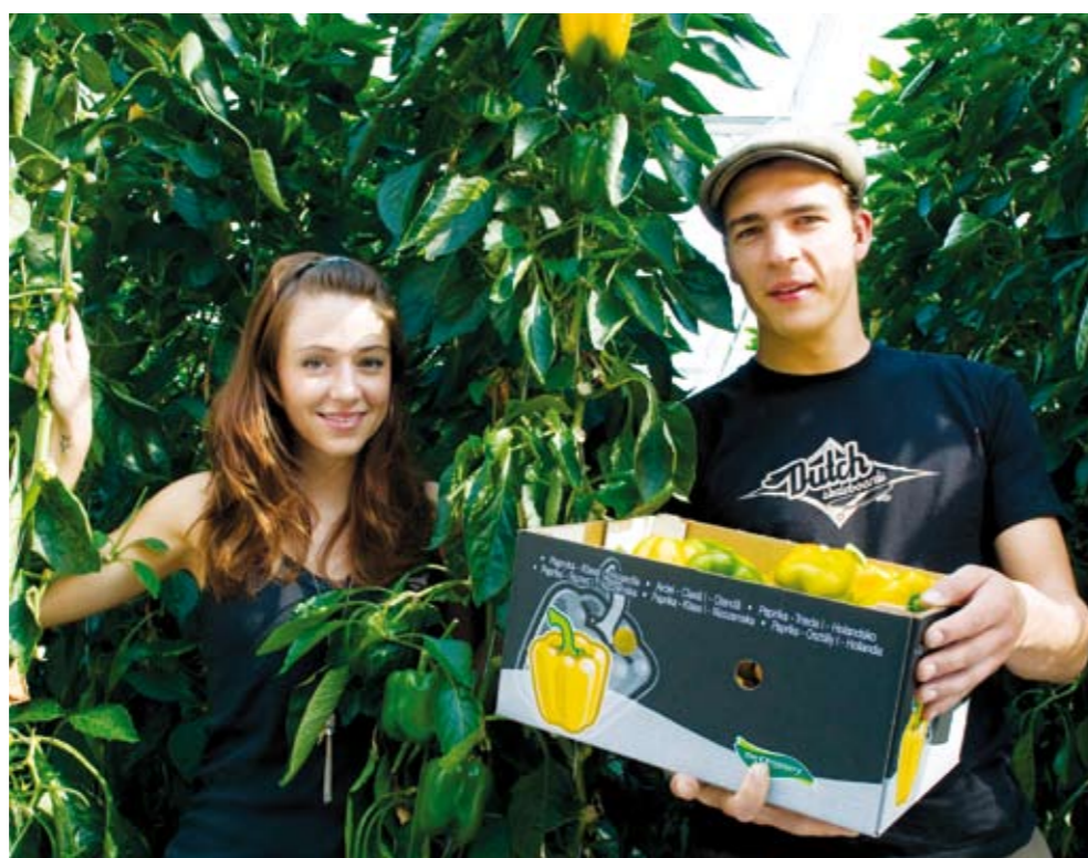
Het grootste deel van de arbeidsmigranten uit Midden- en Oost-Europa is werkzaam in de tuinbouw of de bouwrijverheid

Volgens landelijk onderzoek, werken momenteel circa 200.000 arbeidsmigranten uit de Midden- en Oost-Europese landen in Nederland. Dit is een schatting, omdat het merendeel niet in de Gemeen-