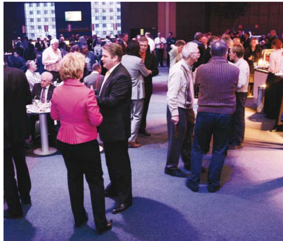
Het jaarcongres van Raadslid.Nu staat in het teken van 'Het raadslid van de toekomst'

politieke ambtsdragers – van raadslid tot minister en alles ertussenin – af en groeien de budgetten. Daardoor wordt de rol van raadsleden meer complex. Dat betekent dat raadsleden voortdurend moeten werken aan ontwikkeling en onderhoud van hun competenties. De invulling van de volksvertegenwoordigende rol, kaders stellen en controleren, zal steeds meer aandacht vragen. Burgers gaan namelijk steeds meer verwachten van hun gemeente."